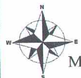
Схема расположения земельных участков на кадастровом плане территории

Утверждена когда-то Администрации Зонального сельского поселения от 09.11.2024 № 330